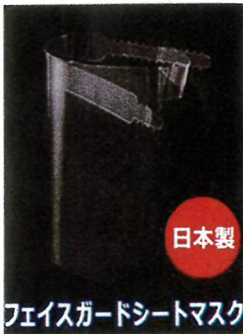
フェイスガードシートマスク